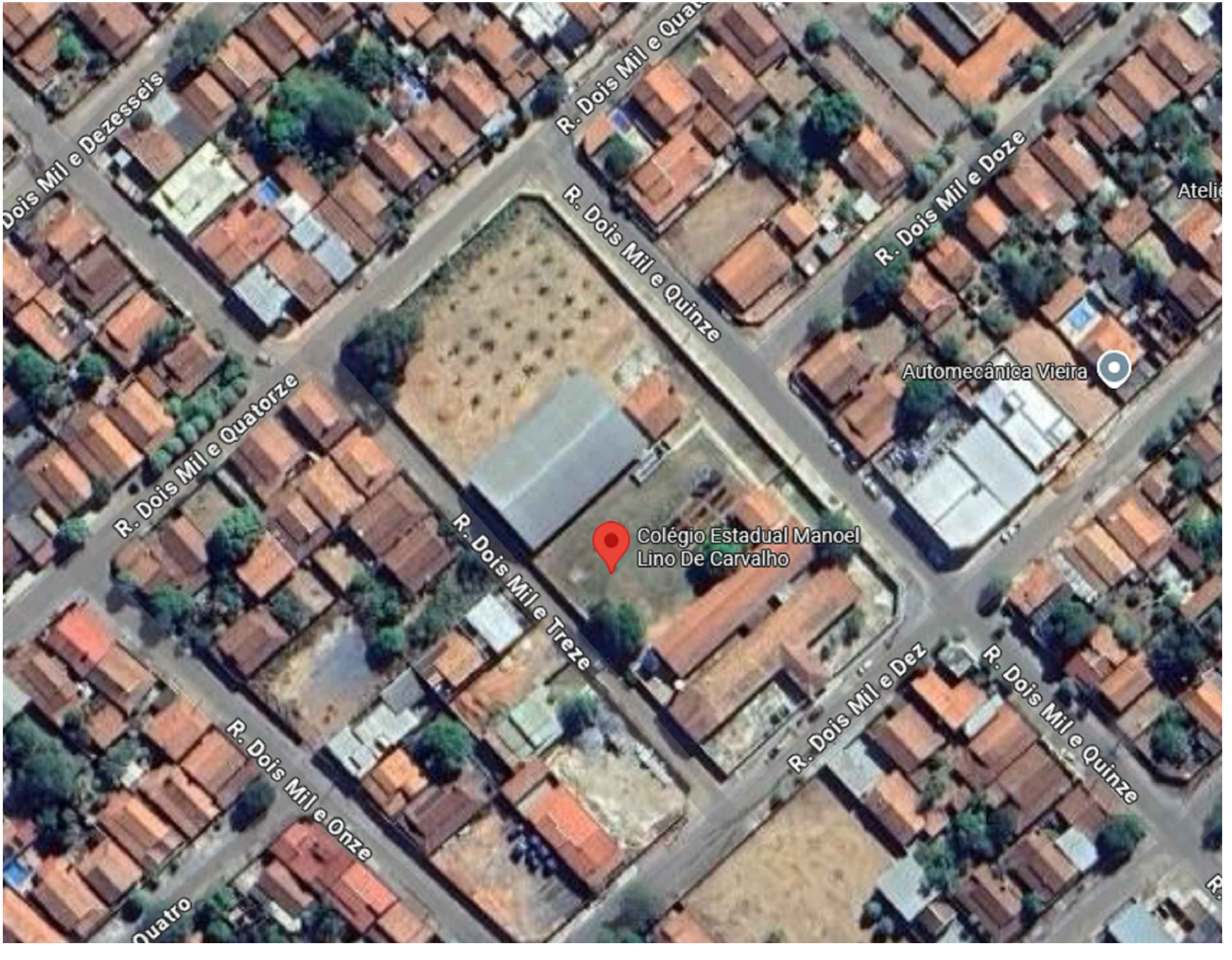
Planta de Localização Sem escala